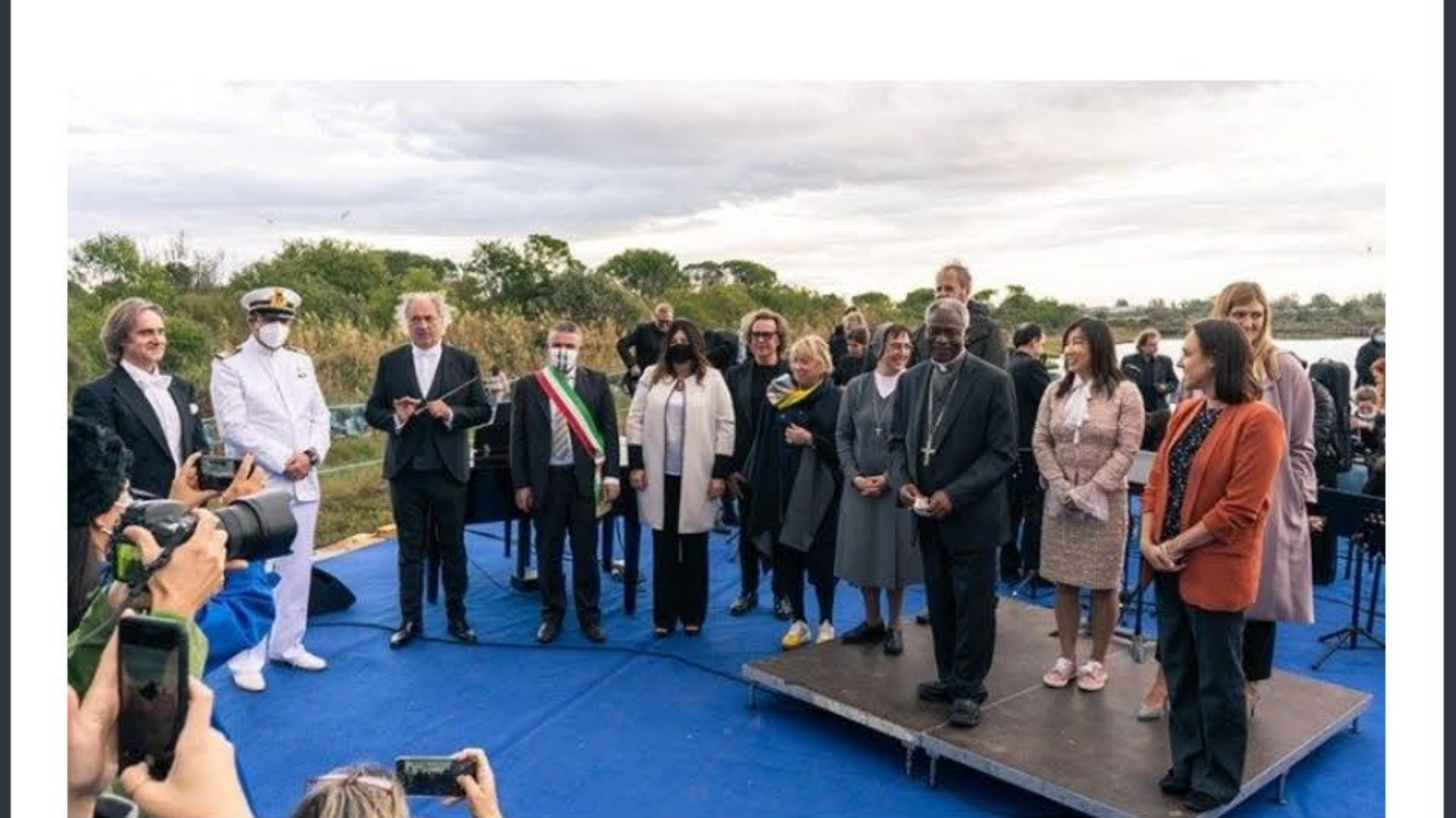
I protagonisti dell'inaugurazione del Giardino Laudato si'

Una "buona e felice interconnessione tra risorse del territorio, vita dell'uomo, attività produttive, educative, sociali, economiche, civiche, cura della natura e del creato, nel rispetto degli ecosistemi e delle biodiversità". Questo il Giardino Laudato si' , sorto nel cuore del Parco regionale veneto del Delta del Po, nelle parole del cardinale Peter Kodwo Appiah Turkson, prefetto del Dicastero per il Servizio dello Sviluppo Umano Integrale che ha fortemente voluto l'iniziativa. Un progetto inaugurato a Rosolina, in provincia di Rovigo, domenica 4 ottobre alla presenza del porporato, con autorità civili, militari e religiose. È stato promosso da sette comuni del territorio, oltre a Rosolina, Ariano nel Polesine, Corbola, Loreo, Porto Viro, Porto Tolle, Taglio di Po, dalla Regione Veneto e da Veneto Agricoltura.