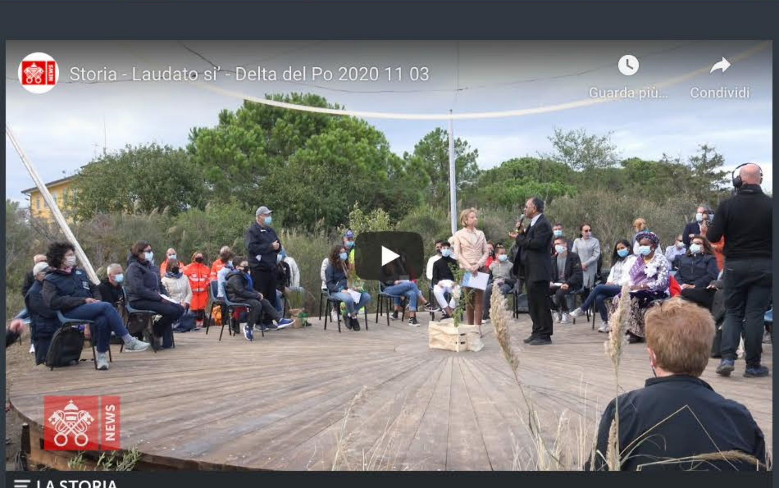
Storia - Laudato si' - Delta del Po 2020 11 03