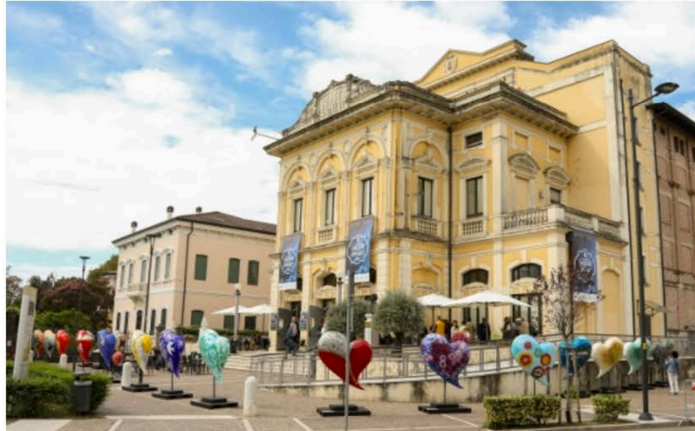
HeartBeats – 16 settembre 2024