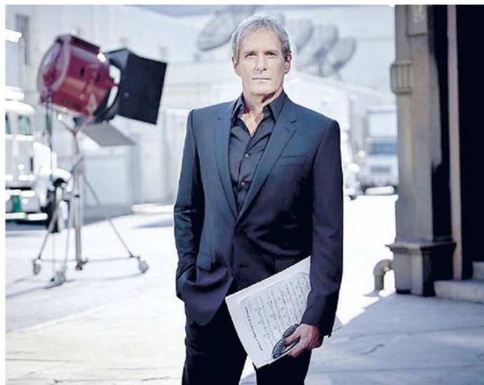
UNICA DATA ITALIANA Michael Bolton sarà sul palco dell'EstEstate Festival la sera di lunedì 3 luglio

«EstEstate - ha esordito lo stesso Gottardo - si prefigge di promuovere il territorio attraverso la cultura. È l'occasione per valorizzare una delle più belle città murate del nostro territorio e renderla più attrattiva. Il programma è ricco di artisti di fama internazionale e pertanto attendiamo tanti spettatori». «Per i quattro spettacoli dedicati ai giovani - ha aggiunto Cavicchi - verrà messo a disposizione un servizio di bus