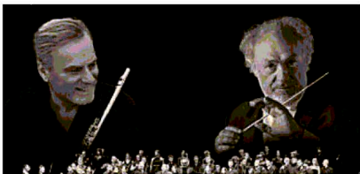
La locandina Il tributo a Ennio Morricone