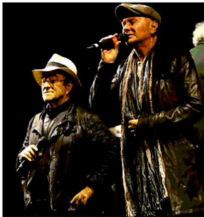
L'omaggio Ron sul palco con Lucio Dalla nel 2010