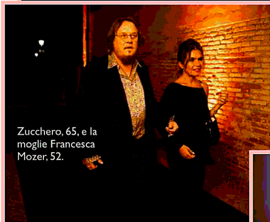
Zucchero, 65, e la moglie Francesca Mozer, 52.