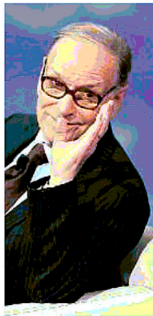
INDIMENTICATO MAESTRO Ennio Morricone poco prima della sua scomparsa