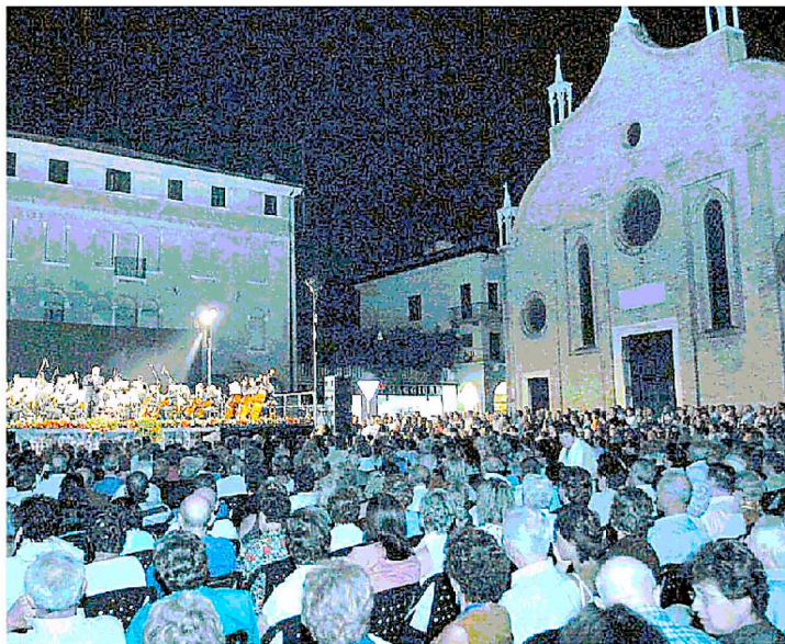
Un Concerto dell'Assunta a Madona Granda. A destra, in alto la conferenza stampa di presentazione e sotto Astor Piazzolla e Freddy Mercury, protagonisti di due tributi